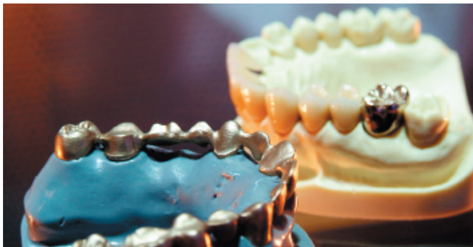
Es ist nicht alles Gold was glänzt!

Seit Jahrzehnten bewähren sich Legierungen als sichere und biokompatible Dentalwerkstoffe, die in ihrer Indikationsbreite andere Materialien immer noch hinter sich lassen. Als besonders hochwertig und biokompatibel gelten